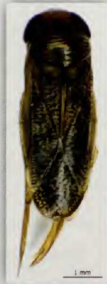
Fig. 2.- Habitus de Sigara (Halicorixa) selecta (Fieber) (♂)